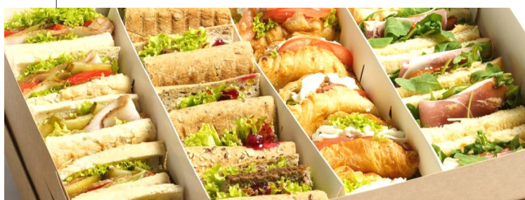
Party box / Finger food