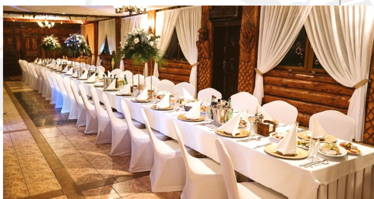
SALA LEŚNA / 20-50 osób

Minimalna liczba osób, dotyczy osób pełnoletnich (powyżej 10 roku życia). Maksymalna liczba osób, stanowi maksymalną liczbę miejsc (łącznie z dziećmi).