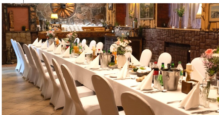
SALA KOMINKOWA / 20-40 osób