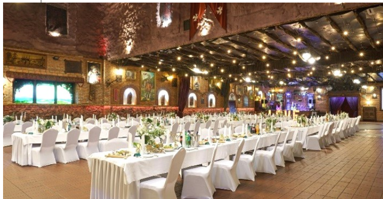
SALA RYCERSKA / 100-300 osób

w ramach niniejszej oferty proponujemy jedną z 6 sal bankietowych