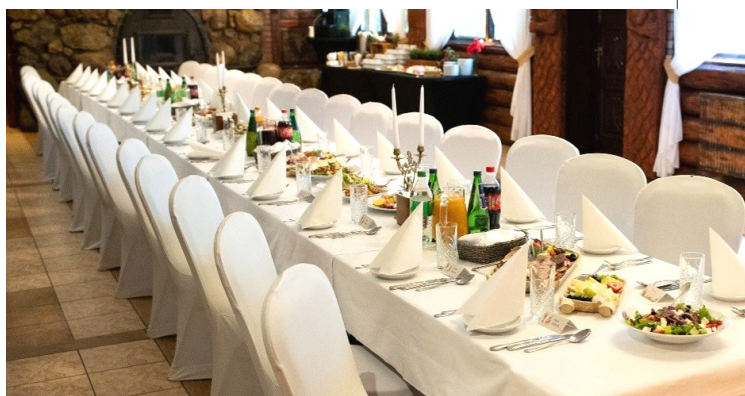
SALA PORTRETOWA / 25-50 osób