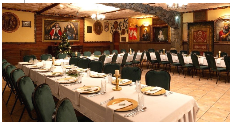
SALA KSIĄŻĘCA / 40-100 osób