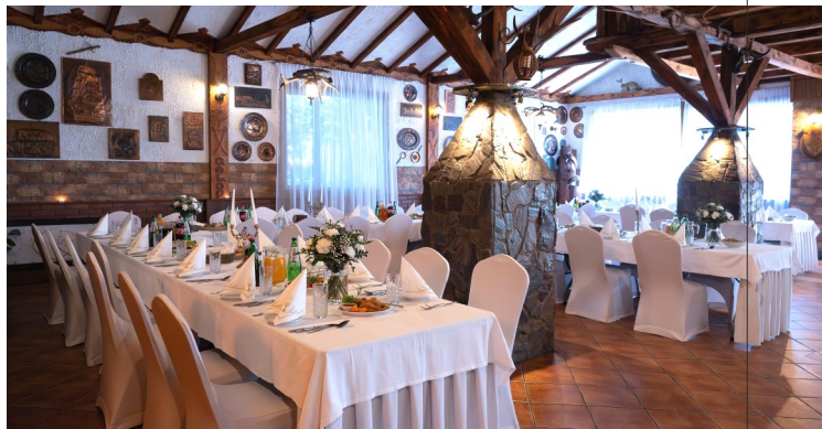
SALA MYŚLIWSKA / 40-75 osób